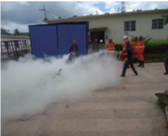
消防器材使用培训